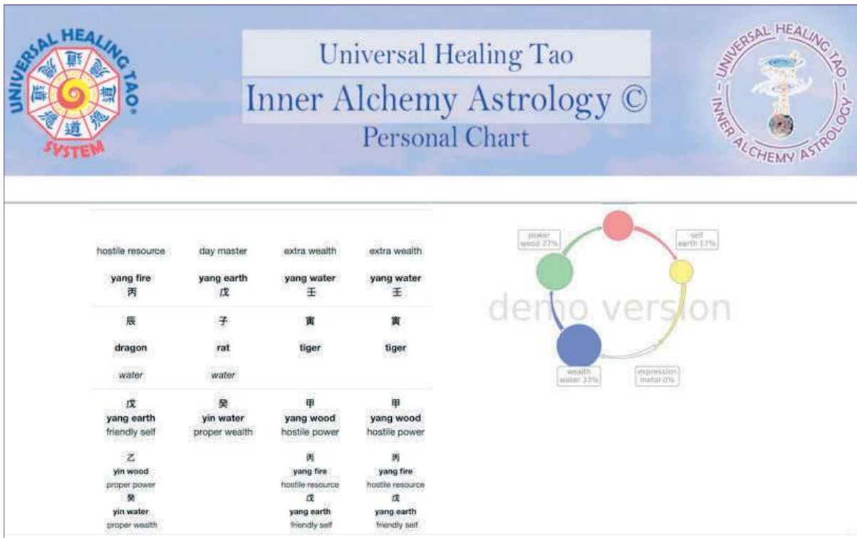
Abbildung 2.1b Berechnetes Demo-Diagramm – Tag 1 des Wassertigerjahres 2022

Das Mondjahr ist das „chinesische Neujahr“, das in China und den chinesischen Bezirken auf der ganzen Welt mit Drachen- und Löwentänzen, Feuerwerkskörpern, besonderen Speisen und kleinen roten Umschlägen mit Geld gefeiert wird und je nach dem ersten Neumond zwischen dem 20. Januar und dem 20. Februar liegt. In der Astrologie und bei Feng-Shui-Berechnungen wird jedoch das solare Neujahr verwendet.