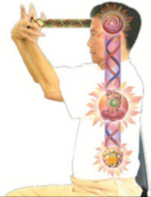
Abb. 22 Verbindung mit dem Dritten Auge, dem Jadekissen und dem Universum im Rücken

Ziehen und die Verbindung des Chi-Flusses fühlen