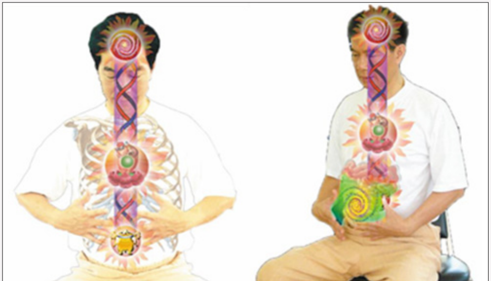
Abb. 25 A Energetisierung von Magen, Bauchspeicheldrüse, Milz und Leber bei MI-16.