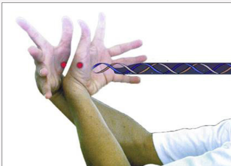
Abb. 21 Spüren Sie die Verbindung zum Universum auf Ihrer Rückseite.