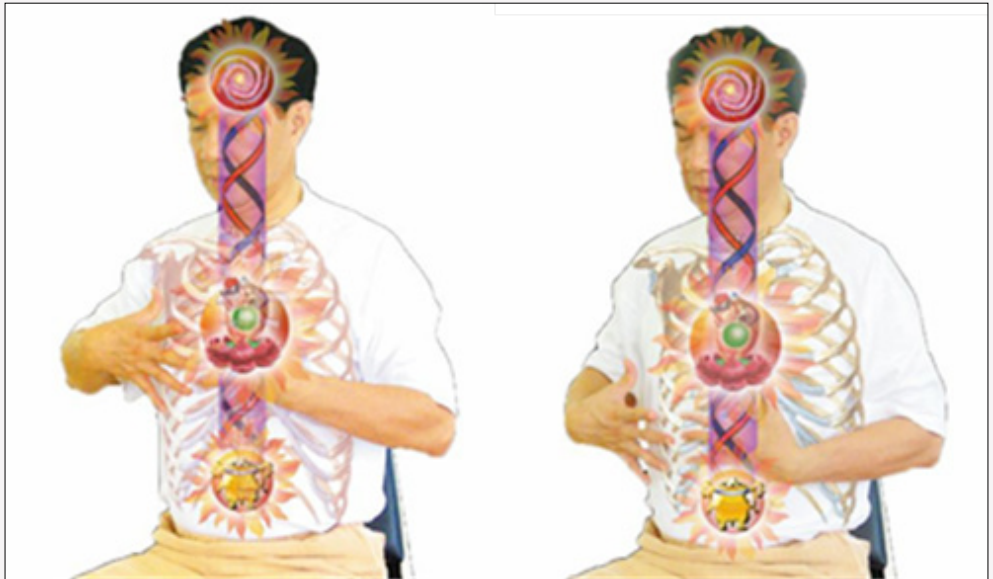
Abb. 24 A Energetisieren und balancieren Sie die Lunge bei MA-16.